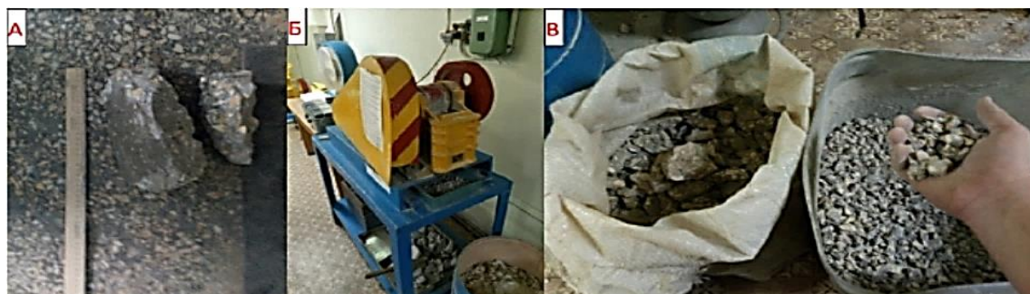
Рисунок 2 – Изготовление бетонного боя: а) демонтированный бетон б) щекодробилка, в) получившийся бой бетона [Production of concrete scraps: a) dismantled concrete b) crusher, c) resulting concrete scrap]

Испытания образцов выполнены согласно ГОСТ 10180, процесс испытаний изображен на рисунке 2. Настоящий стандарт распространяется на бетоны всех видов по ГОСТ 25192, применяемые во всех областях строительства, и устанавливает методы определения предела прочности бетонов на сжатие, осевое растяжение, растяжение при раскалывании и растяжение при изгибе путем разрушающих кратковременных статических испытаний специально изготовленных контрольных образцов бетона.