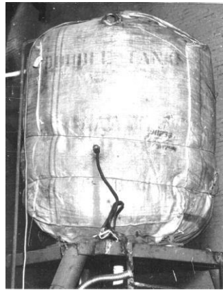
Рисунок 2 – Общий вид расширительного бака с термоизоляцией в системе высокотемпературного охлаждения ДВС [General view of the expansion tank with thermal insulation in the high-temperature cooling system of the internal combustion engine]

установлена термopа (находилась в объеме охлаждающей жидкости РБ). Общий вид этого расширительного бака представлен на рисунке 2.