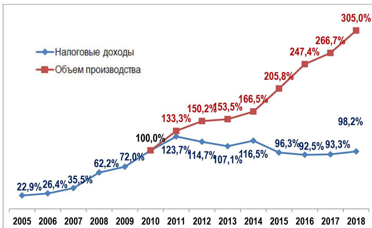
Рисунок 2 – Динамика производства и налоговых отчислений по г. Волгодонску (в % к 2010 г.) [13] [Dynamics of production and tax deductions for the city of Volgogradsk (as% of 2010)]

Динамика производства и отчислений по г. Волгодонску представлена на рисунке 2.