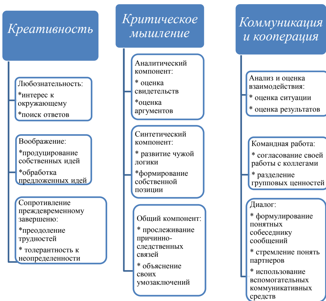
Рисунок 1 – Структура модели «4К» [«4K» model structure]

Развитие и укрепление традиционных форматов взаимодействия университетов с технологическим бизнесом должно идти в направлении выстраивания согласованных и взаимосвязанных стратегий, ориентированных на постоянную адаптацию к меняющимся условиям и в сфере экономики, и в сфере образования. Интерес для бенчмаркинга могут представлять практики ВИТИ НИЯУ МИФИ: программа развития и образовательные программы вуза согласованы и проходят обязательную экспертизу основными предприятиями-работодателями, функционирует ресурсный центр «ГК «Росатом»-НИЯУ МИФИ», центр профессиональных компетенций при крупном промышленном партнере – Филиал АО «АЭМ-технологии» «Атоммаш» в г. Волгодонск, научно-исследовательский институт проблем атомного энергомашиностроения, МНПК «Безопасность ядерной энергетики» (глубина архива – 15 лет), журнал «Глобальная ядерная безопасность», индексируемый в международных репозиториях (рис. 2). Ежегодно студенты принимают участие в конкурсах инновационных проектов, инициируемых, в т.ч. промышленными предприятиями (ТеМП, «Зеленый квадрат», У.М.Н.И.К. и пр.) [11-13].