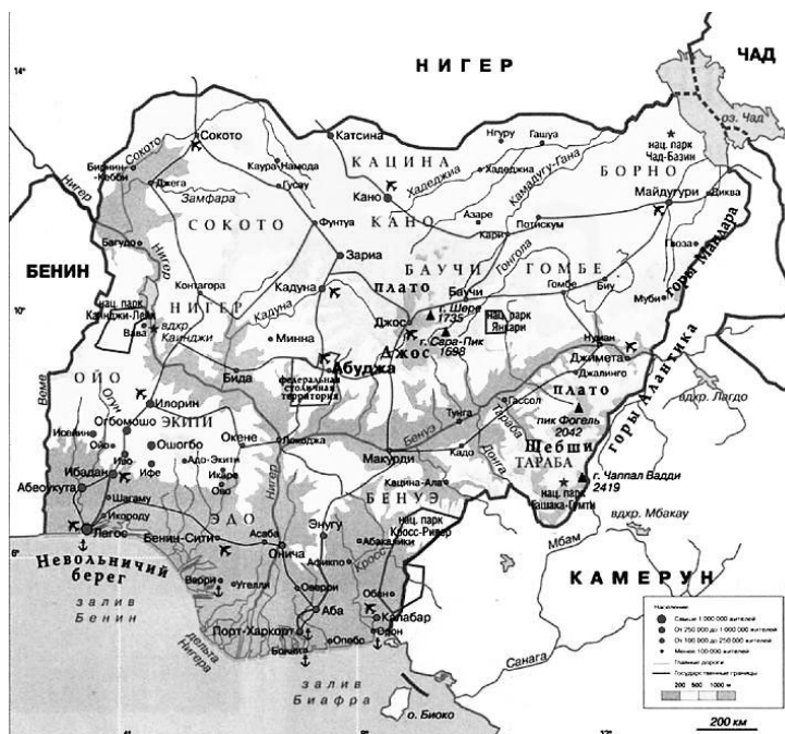
Рисунок 1 – Геополитическое положение Нигерии [The geopolitical position of Nigeria]

Нигерия среди африканских стран обладает самой большой экономикой, но её энергетический сектор работает недостаточно эффективно. Это оказывает негативное влияние на развитие некоторых областей промышленности, сельского хозяйства и, в конечном итоге, на жизненный уровень населения. Ниже приведём краткую характеристику состояния экономики и социального положения населения Нигерии.