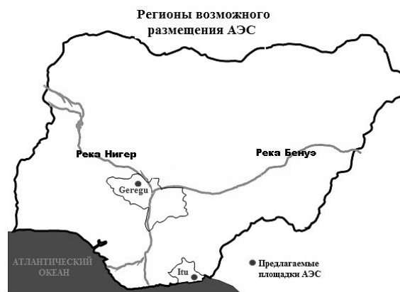
Рисунок 2 – Регионы для возможного размещения площадок под АЭС в Нигерии [Regions of the possible location of NPP sites in Nigeria]

Федеральное правительство Нигерии (FGN) намеренно подчеркивает приверженность вопросу строительства атомных электростанций для выработки электроэнергии, поскольку признает, что реализация ядерно-энергетической программы является непростой задачей [18]. Регионы для возможного размещения АЭС приводятся на рисунке 2, и представляют собой область Герегу (GEREGU), которая находится в штате Коги, в непосредственной близости от Абуджи в районе Аджакута местного самоуправления штата Коги в северной центральной зоне страны, и область Иту (ITU) – в районе местного самоуправления Иту штата Аква-Ибом на южном побережье Нигерии в дельте реки Нигер, как показано на схематической карте. Область Герегу находится в зоне слияния рек Нигер и Бенуэ.