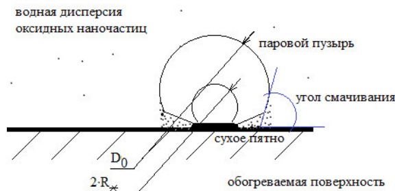
Рис. 2. – Одиночные паровые пузыри в НЖ (Стадия 2 процесса)

При испарении дисперсии в пузырь НЧ, находившиеся в данном объеме дисперсии, частично переходят в жидкий микрослой под пузырем, откуда оседают при выпаривании этого микрослоя (рис. 2):