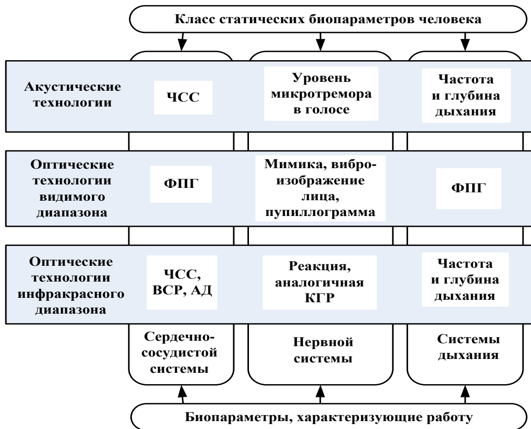
Рис. 3. – Основные представители второго класса биопараметров [The main components of the second class bioparameters]

Анализ данных параметров на более продолжительных временных интервалах позволяет выявлять случаи хронической усталости, утомления, нервного истощения. Принятие своевременных лечебных и восстановительных мер, либо решения о смене места и характера работы позволяет эффективно решать проблему сохранения человеческого капитала.