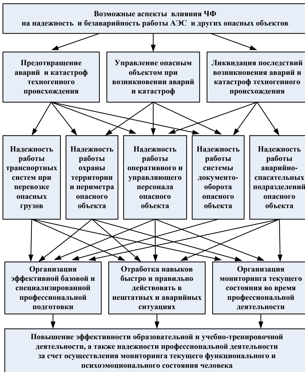
Рис. 1. – Многоплановость влияния ЧФ на надежность и безаварийность работы АЭС и других опасных объектов [Multidimensionality of human factor influence on reliability and trouble-free operation of NPP and other hazardous objects]