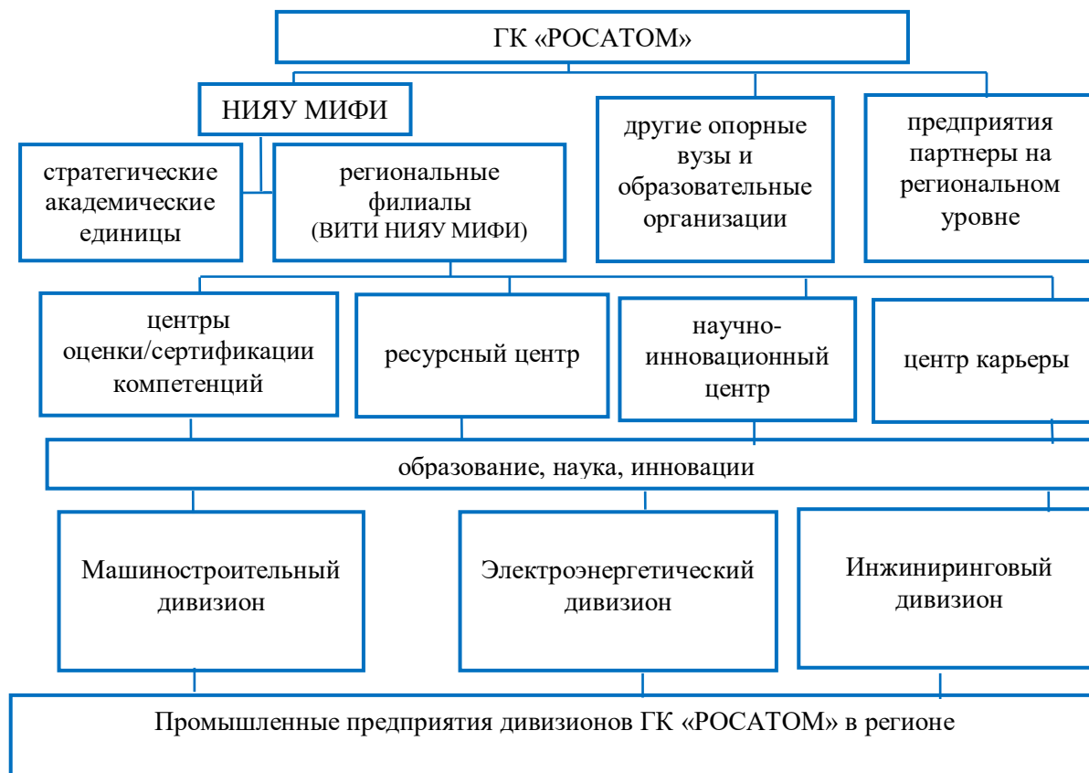
Рисунок 1 – Пример эффективных форм взаимодействия отраслевых вузов с промышленными партнерами [An example of effective forms of industry universities and industrial partners interaction]

координируемой в АО «Концерн Росэнергоатом» департаментом международного бизнеса и развития и АО «Русатом Сервис» (табл. 1).